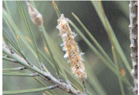
■ Puesta depredada