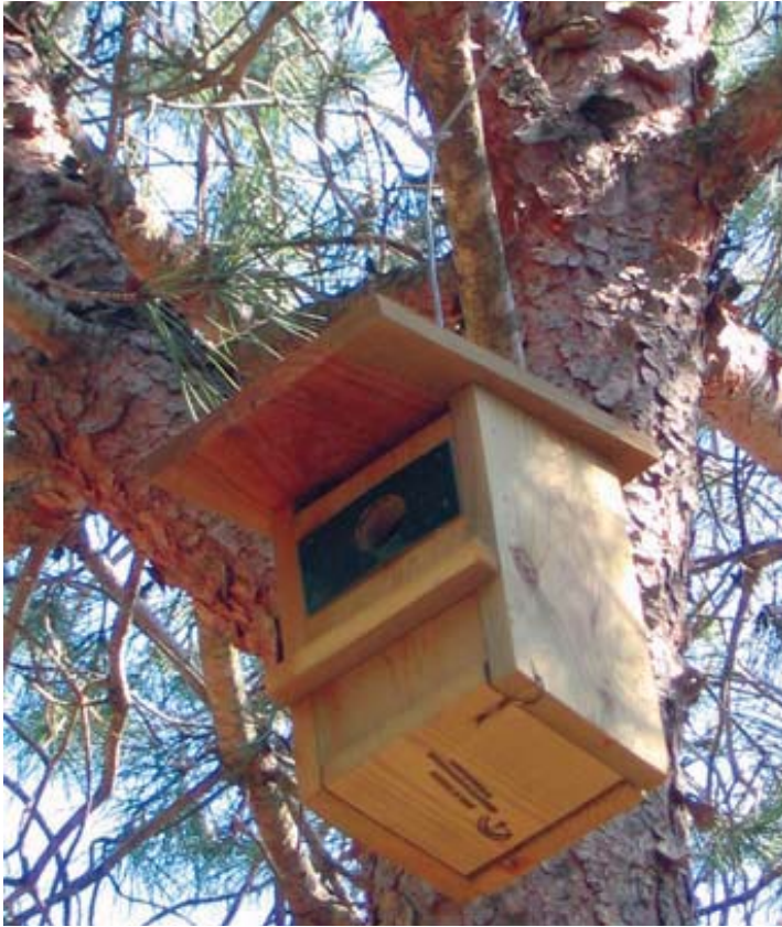
■ Caja anidadera