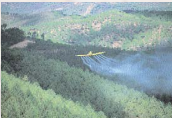
■ Tratamiento químico aéreo