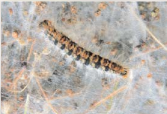
■ Oruga de Procesionaria