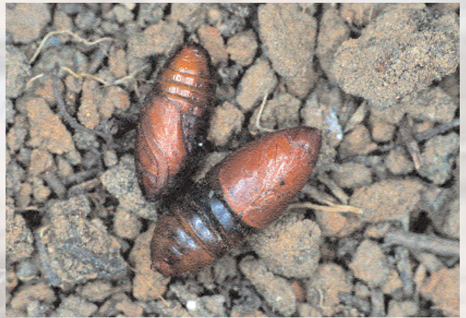
■ Crisálidas desprovistas del capullo de protección.