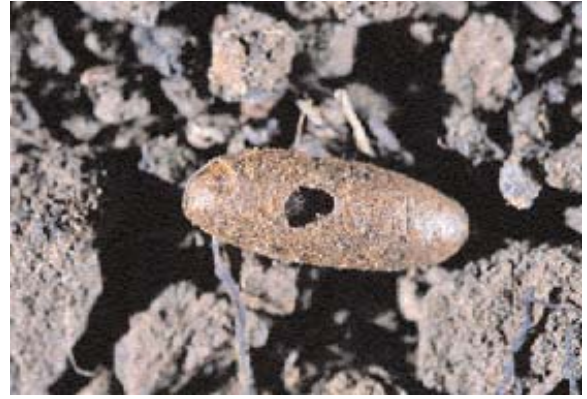
■ Crisálida parasitada