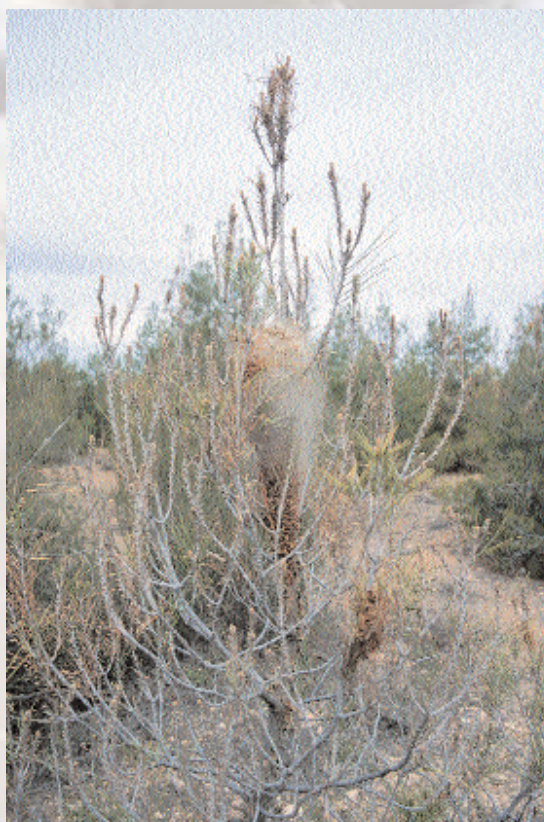
■ Pino joven defoliado por Procesionaria

El principal daño que causa la procesionaria a la masa es la defoliación de pies del género Pinus , producida durante la fase larvaria de este lepidóptero. Por otra parte la larva tiene unos pelos urticantes que producen reacciones alérgicas más o menos graves al hombre. Estas molestias impiden que se cumpla una de las principales funciones de los montes andaluces, el uso recreativo. Por otra parte, y de gran importancia son las perturbaciones que provoca su presencia en una serie de trabajos selvícolas como las podas o la recogida de piña, ocasionando graves pérdidas económicas. Directamente sobre los pies produce una pérdida de crecimiento que perdura hasta cuatro años después de la defoliación, pero en muy raras ocasiones causa la muerte de los pies. En repoblaciones jóvenes las defoliaciones totales sucesivas pueden provocar una subsistencia precaria de la masa impidiendo que se consiga la función protectora plena de la repoblación.