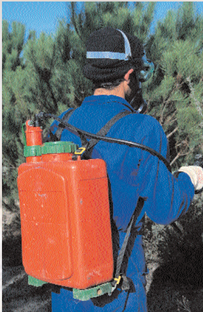
■ Tratamiento químico manual de los bolsones