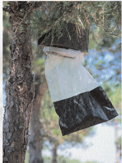
■ Colocación masiva de trampas de feromonas

datos sobre el nivel de ataque, dichos datos servirán para poner en práctica los métodos de control, que normalmente guardan una relación directa con el nivel de plaga alcanzado, según se muestra a continuación