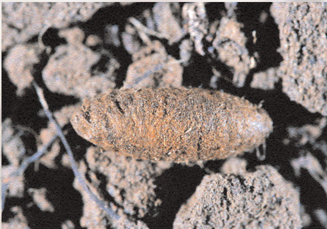
■ Capullo sedoso desenterrado.

longitud, siendo de mayor tamaño las de las hembras. La crisálida puede permanecer en este estado entre un mes y cuatro años, es el llamado periodo de diapausa.