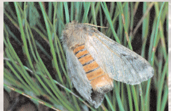
■ Hembra de Thaumetopoea

parte posterior, donde presenta un penacho de pelos de color marrón claro. Las alas anteriores son de color grisáceo, con intensidad variable, con tres franjas transversales más oscuras. Las alas posteriores son blanquecinas, con la parte más próxima al cuerpo muy pelosa.