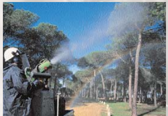
■ Tratamiento químico con cañón

La presencia de predadores y parásitos es muy importante, por lo que se colocan cajas anidaderas en lugares en los que la nidificación de las aves trogloditas es complicada por la ausencia de los huecos que