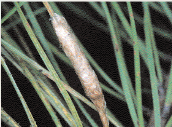
■ Puesta de Procesionaria

Oruga: la oruga experimenta desde su nacimiento cuatro mudas, pasando por cinco estadios larvarios. Recién emergida del huevo mide unos 3 mm y alcanza, tras la cuarta muda, durante el quinto estadio, entre 25 y 40 mm. A partir del tercer estadio tienen el aspecto característico; pelosas, de coloración parda, con los pelos blanquecinos y es a partir de este estadio cuando desarrollan los pelos urticantes que las hacen tan molestas pudiendo causar graves molestias. Estos pelillos son lanzados al aire cuando algo las molesta o perturba. En el quinto estadio, una vez que han completado su