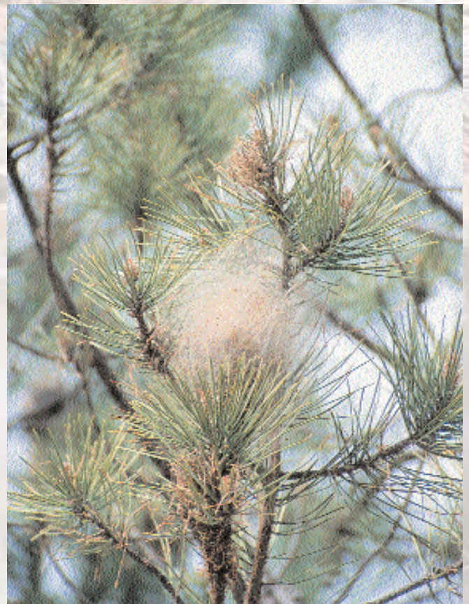
■ Bolsón de Procesionaria.

durar el doble e incluso puede precisar más de un año para completar su ciclo biológico entero.