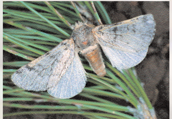
■ Macho de Thaumetopoea